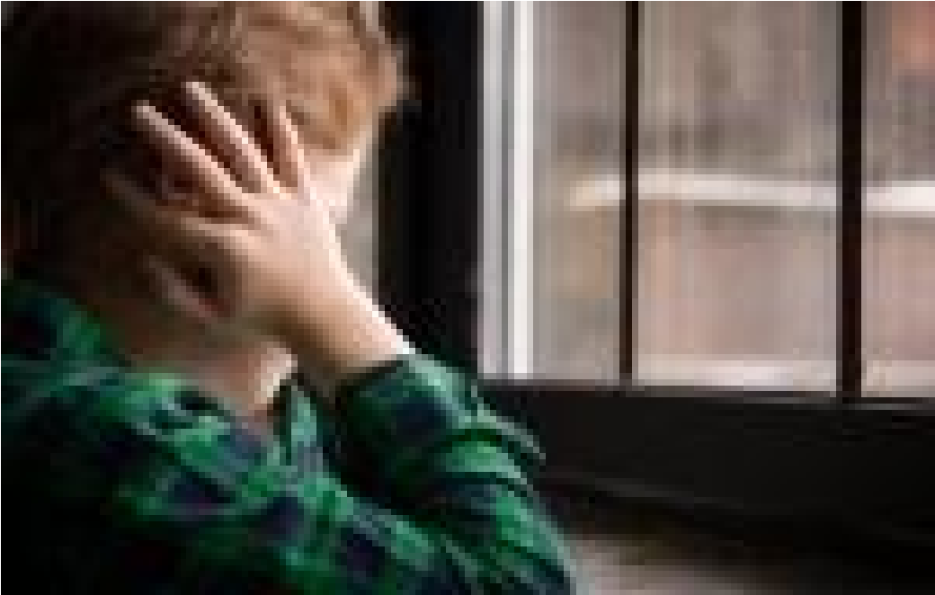
( https://www.pourquoidocteur.fr/Articles/Question-d-actu/34234-L-autisme-provoque-desequilibre-microbiote-intestinal )

L'autisme provoqué par un déséquilibre du microbiote intestinal ( https://www.pourquoidocteur.fr/Articles/Question-d-actu/34234-L-autisme-provoque-desequilibre-microbiote-intestinal )